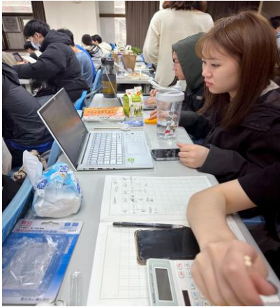
圖 3 學生分組知識翻新討論