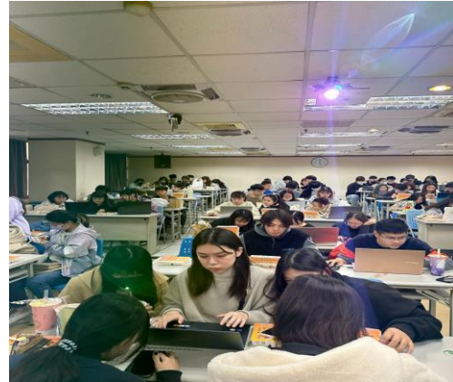
圖 4 針對同一天的三個班比賽