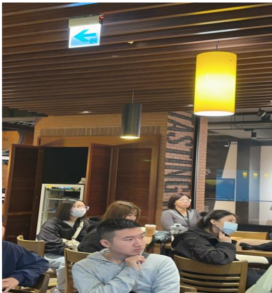
圖 7 分工合作、知識翻新了解 GB 鮮釀公司財務情況