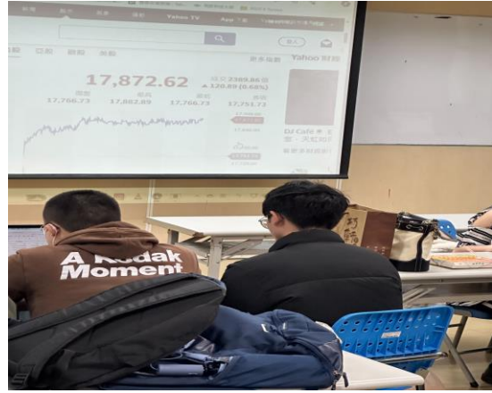
圖 2 期末百餘位同學進行分組比賽