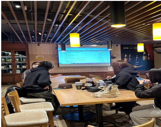
圖 5 線上虛擬投資比賽