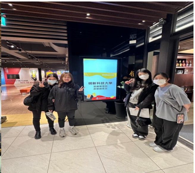
圖 8 上市公司現場分組實作-讓學生熟悉財報