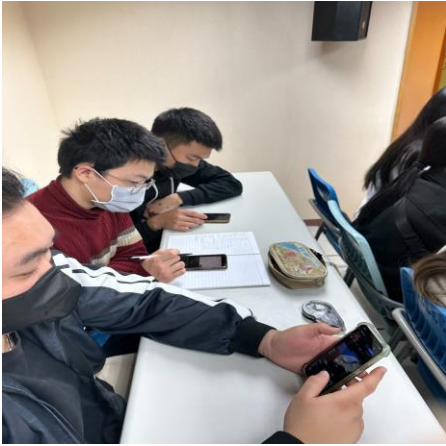
圖 1 學生分組進行投資比賽